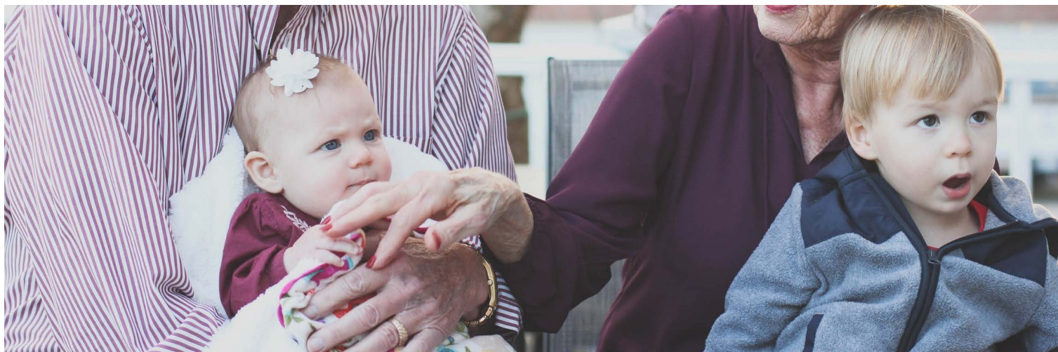
Табела 2 – Ефектот од социјалната пензија врз нееднаквоста

Праговите се однесуваат за 2016 година.