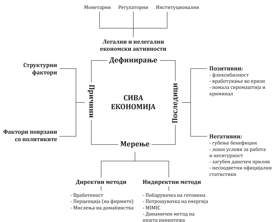
Слика 1: Дефинирање, мерење, причини и последици од сивата економија

нивното мерење и дефиницијата се стеснува на законските економски активности кои намерно се скриени од државата со цел: (1) да се избегне плаќање даноци и придонеси; (2) да се избегне задоволување на стандардите на пазарот на труд (пр., минимална плата, сигурност при работа, максимален број на работни часови итн); и (3) да се избегне усогласување со административните процедури.