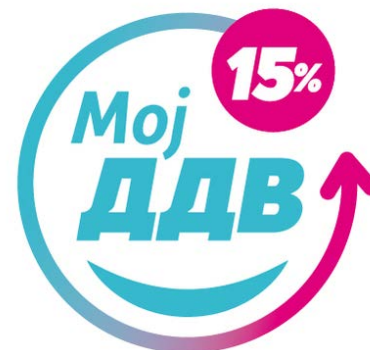
Табела: Ефектот од „Мој ДДВ“ врз неформалната економија

Според наодите, во просек околу 10% од обемот на неформалната економија би бил намален односно префрлен во формалната економија со мерката „Мој ДДВ“, што е еквивалент на 2.3 процентни поени од обемот на сивата економија пресметан од Finance Think.